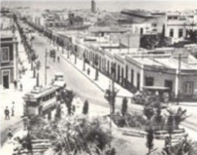
Santa Cruz de Tenerife

Antes de la llegada de los conquistadores castellanos, el territorio donde hoy se asienta la ciudad estaba constituido por zonas de vegetación salvaje pertenecientes al menceyato (reino) de Anaga, que gobernaba el Mencey Beneharo. La historia prehispánica de la ciudad está protagonizada por el legado de los guanches y por algunas expediciones extranjeras que llegaban a la costa. En 1494, en uno de estos viajes, arribaron los castellanos y establecieron en Santa Cruz el campamento base para la conquista de la isla, que se prolongó hasta 1496, año en que Tenerife fue incorporada a la Corona de Castilla.